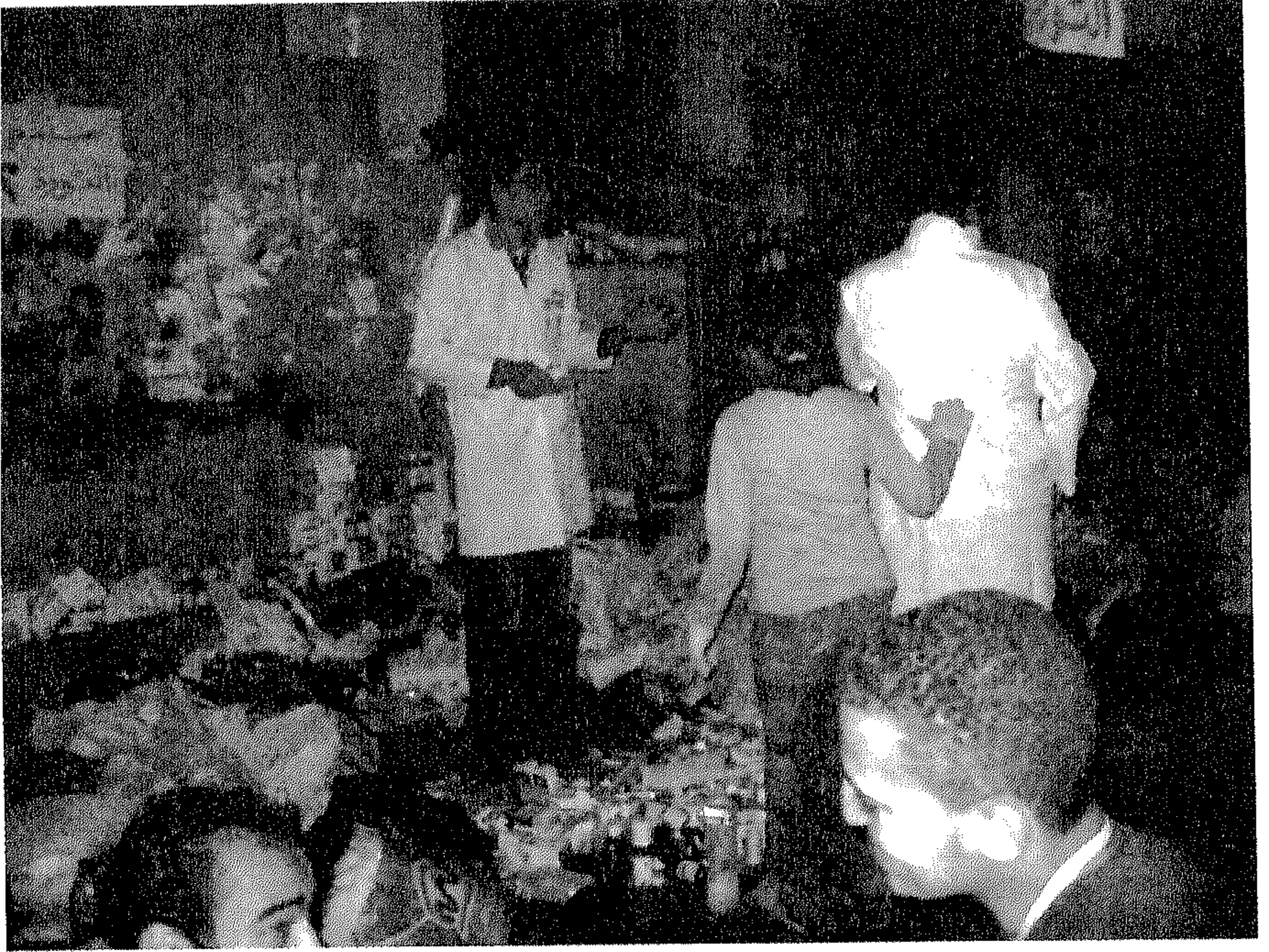
صورة من وحدة المستشفى الميداني على خط النار بشارع عبد المنعم رياض